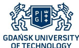
Rys. 2.1. Godło Politechniki Gdańskiej a) w polskiej wersji językowej, b) w angielskiej wersji językowej

Podpis pod rysunkiem, czcionka o wielkości 9 pkt, powinien być wyśrodkowany, bez kropki na końcu. Górny odstęp akapitu powinien być ustawiony na wartość 6 pkt, a dolny 12 pkt, interlinia wynosi 1 wiersz.